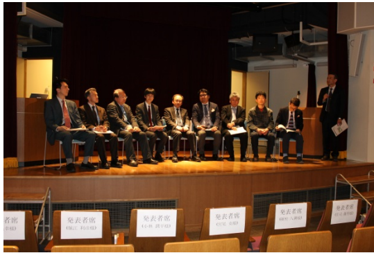
質疑応答・自由討論の様子

続いて全講演者に登壇いただき、来場者との質疑応答・自由討論が行われました。 来場者からも活発な質問が相次ぎ、会場は熱気につつまれました。